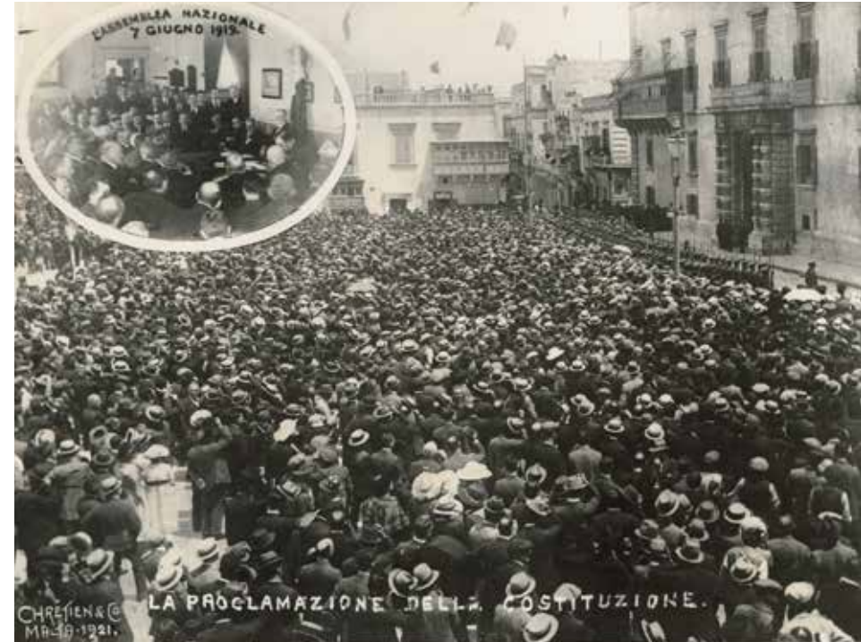
Kartolina li tura miġemgħa fi Pjazza San Ġorġ, il-Belt Valletta barra l-Palazz fejn kienet qed tiġi pproklamata l-Kostituzzjoni tal-gvern awtonomu ta' Malta. Ritratt żgħir: Laqgħa nhar is-7 ta' Ġunju 1919 tal-Assemblea Nazzjoni fi sforz nazzjonali għall-Kostituzzjoni.

Wara l-1966, l-unika darba li kandidati li ma ikkontestawx f'isem il-PN u l-PL kisbu aktar minn 2% tal-voti kien fl-2017 u għalhekk jista' jiġi argumentat li dan ma kienx jagħmel differenza għal partiti minuri. Iżda l-kontroargument huwa li l-imġiba tal-votanti tista' tkun differenti jekk ikunu konxji li l-vot tagħhom ma jkunx 'moħli' jekk il-partit tagħhom ikun jista' jikseb siġġu fil-Parlament jekk votanti tal-istess fehma jammontaw għal 5% tal-popolazzjoni.