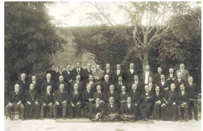
Il-membri tal-ewwel Parlament ta' Malta (Assemblea Legislativa u Senat) eletti fl-1921.

Din l-esperjenza mhijiex unika għal Malta. Il-mudell Westminster hafna drabi ma iproduciex demokrazija b'saħħithom. Diversi pajjiżi li kisbu l-indipendenza mir-Renju Unit fit-tieni nofs tas-seklu għoxrin komplew isofru krizijiet demokratiċi profondi, u waqgħu f'tirannija u despotiżmu. Dan ma ġarax kullimkien iżda huwa biżżejjed biex juri li r-rabta mal-mudell ta' Westminster waħedha mhix garanzija ta' sopravvivenza demokratika.