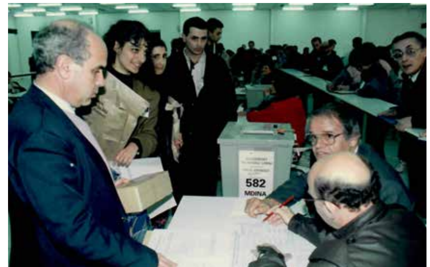
Fig: L-ewwel elezzjonijiet lokali f' Malta nhar l-20 ta' Novembru 1992. Ir-ritratt juri l-ftuh tal-kaxxi tal-voti qabel l-għadd. Taht: Il-kaxxa tal-voti tal-Kunsill Lokali tal-Imdina tasal fiċ-ċentru tal-għadd nhar it-22 ta' Jannar 1994.